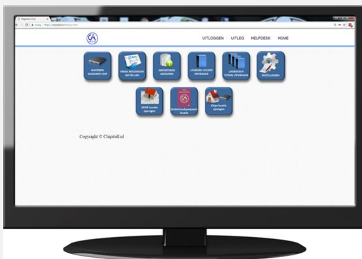
Web – based module

Als de smartphone met NFC functie bij de Chip wordt gehouden zal hij de informatie van de Chip ophalen en weergeven in de browser van de smartphone. 90% van de Android toestellen beschikken over deze functie, iPhone heeft deze functie vrijgeven vanaf de iPhone 7 en nieuwer.